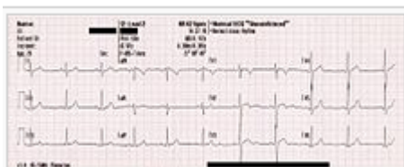
Figure 2 : Un exemple d'électrocardiogramme